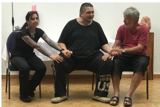
Bild 1: Dieses Foto zeigt wie das Medium bei allen Phänomenen die im Raum aktiv sind, an Armen und Beinen kontrolliert wird, um auszuschließen, dass es selbst im Raum herumläuft.