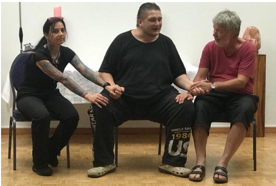
Bild 1: Dieses Foto zeigt wie das Medium bei allen Phänomenen die im Raum aktiv sind, an Armen und Beinen kontrolliert wird, um auszuschließen, dass es selbst im Raum herumläuft.