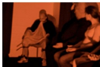
Historische und aktuelle Fotografien einer der zentralen Erscheinungsformen der Physikalischen Medialität.

Das Auftreten einer feinstofflichen Substanz, die unter dem Namen Ektoplasma fragwürdige Berühmtheit erlangt hat.